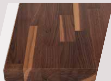
Nuss (amerik.) Parkett