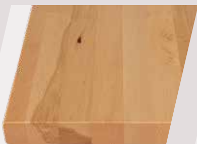
Buche Parkett natur