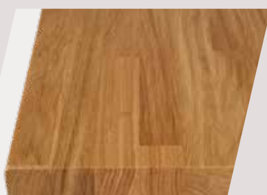
Eiche Parkett natur